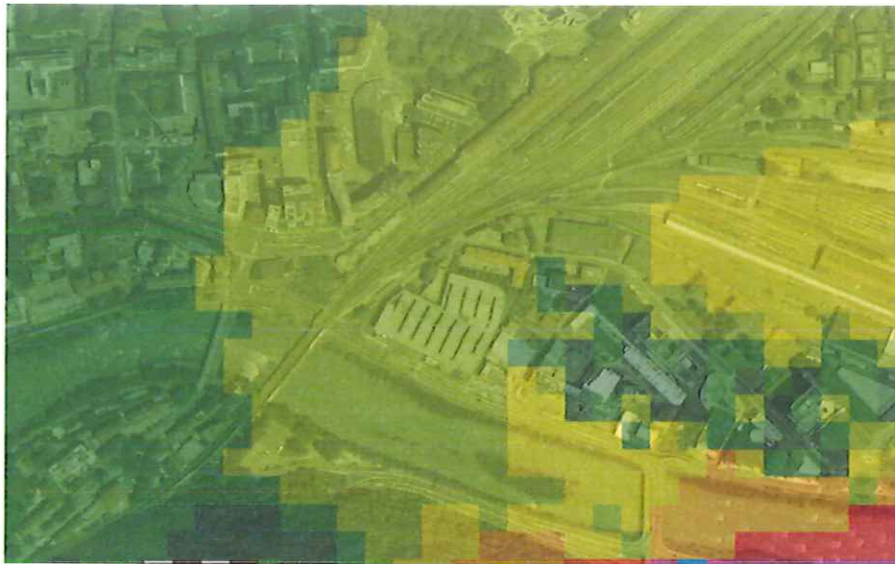
Inquinamento acustico A22 - diurno