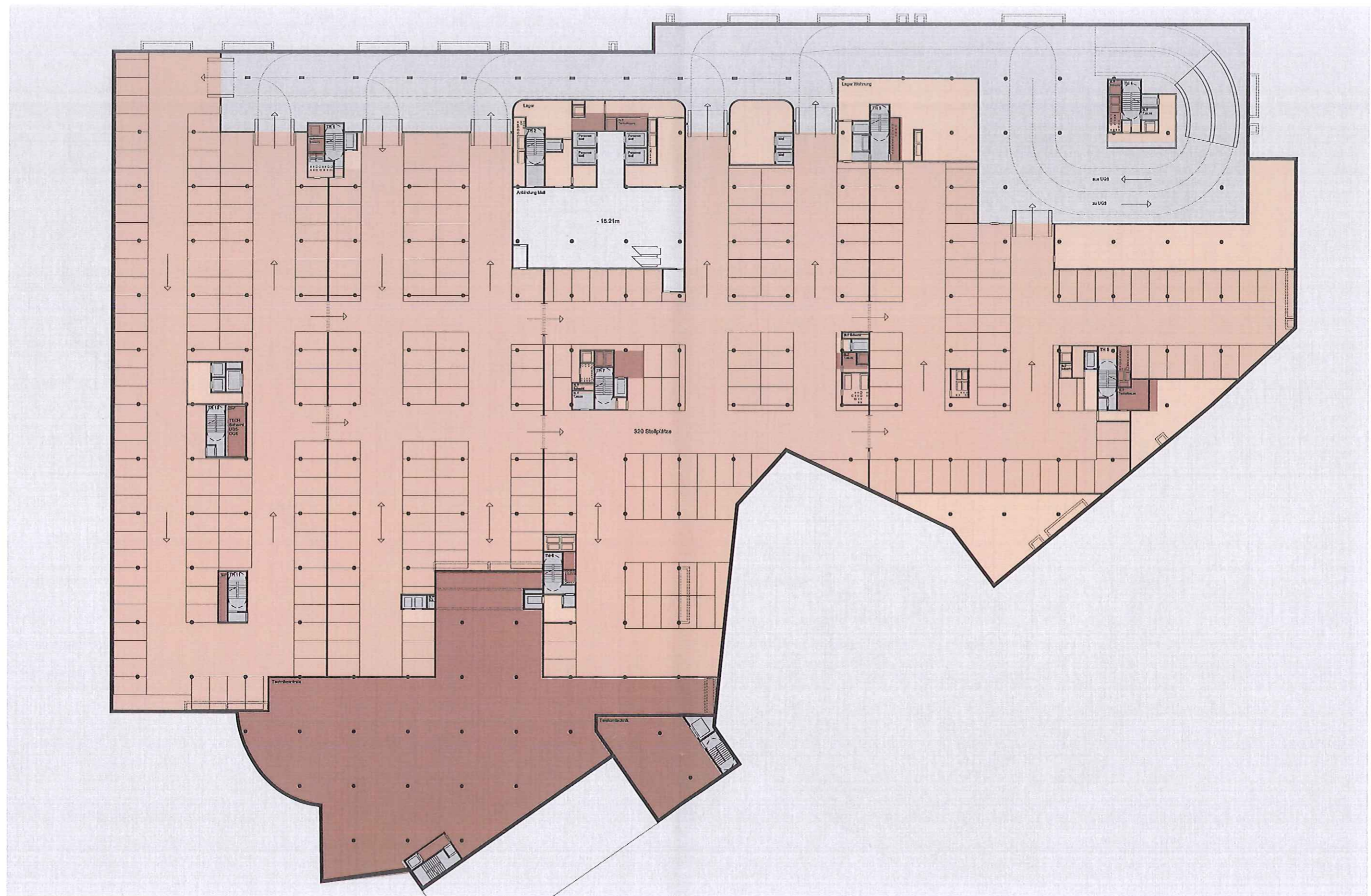
4° piano interrato 4. Untergeschoss