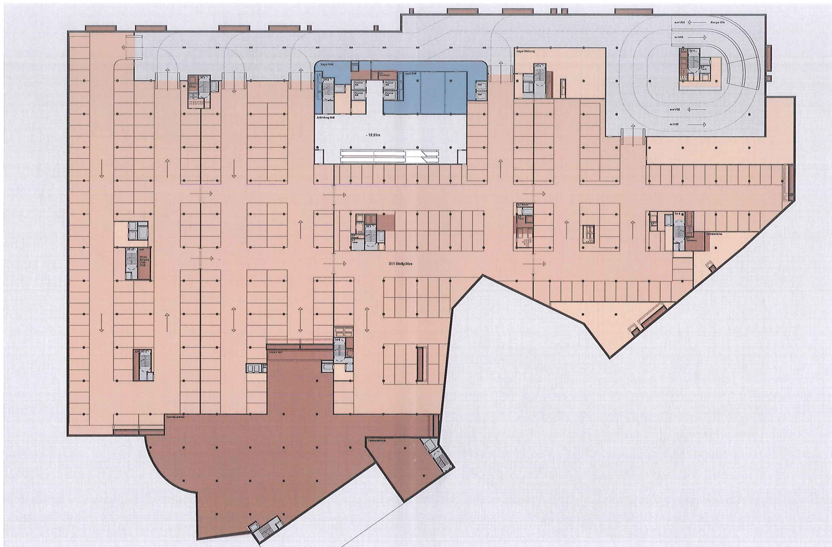
3° piano interrato 3. Untergeschoss