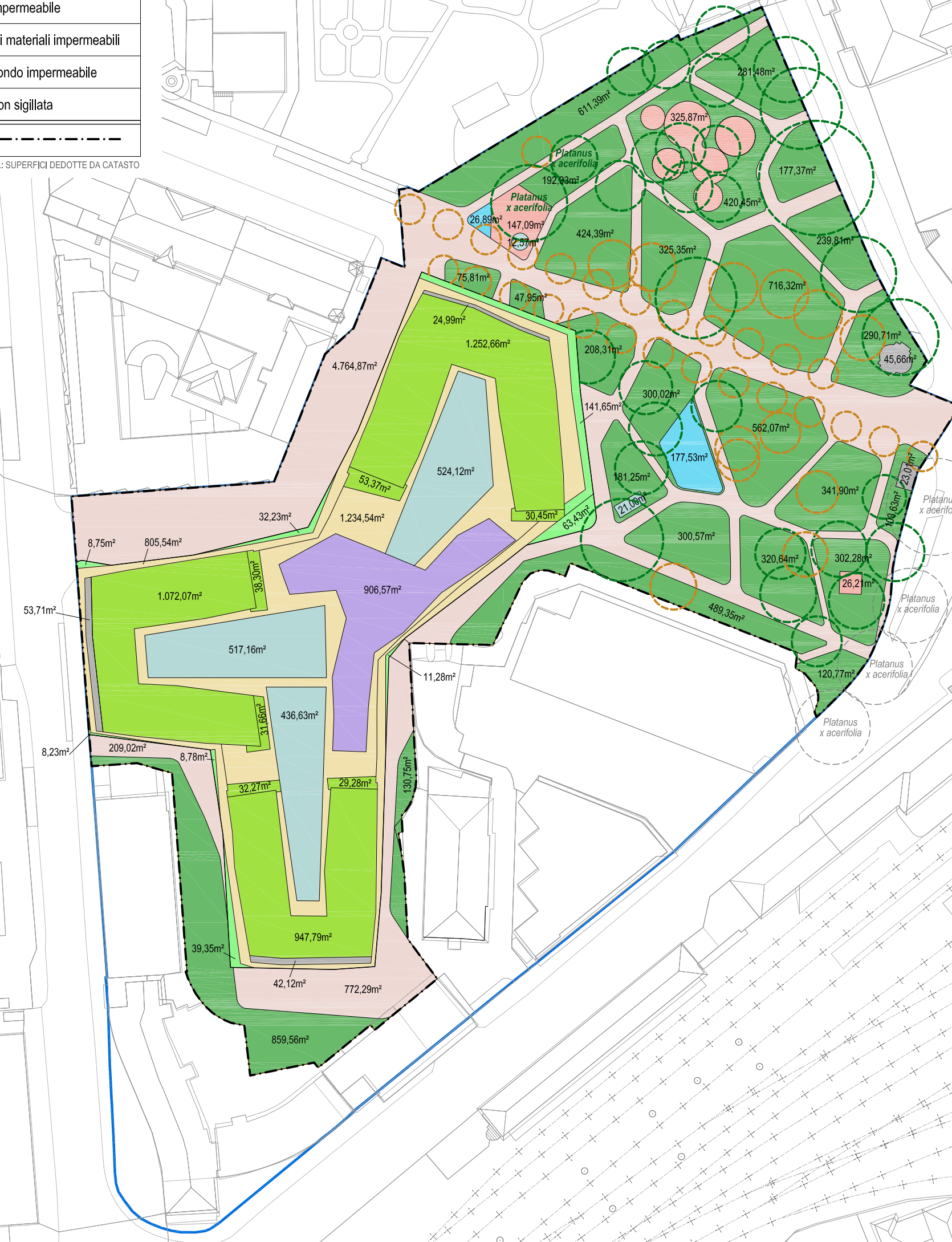
PLANIMETRIA DI PROGETTO LAGEPLAN PROJEKT 1:1000