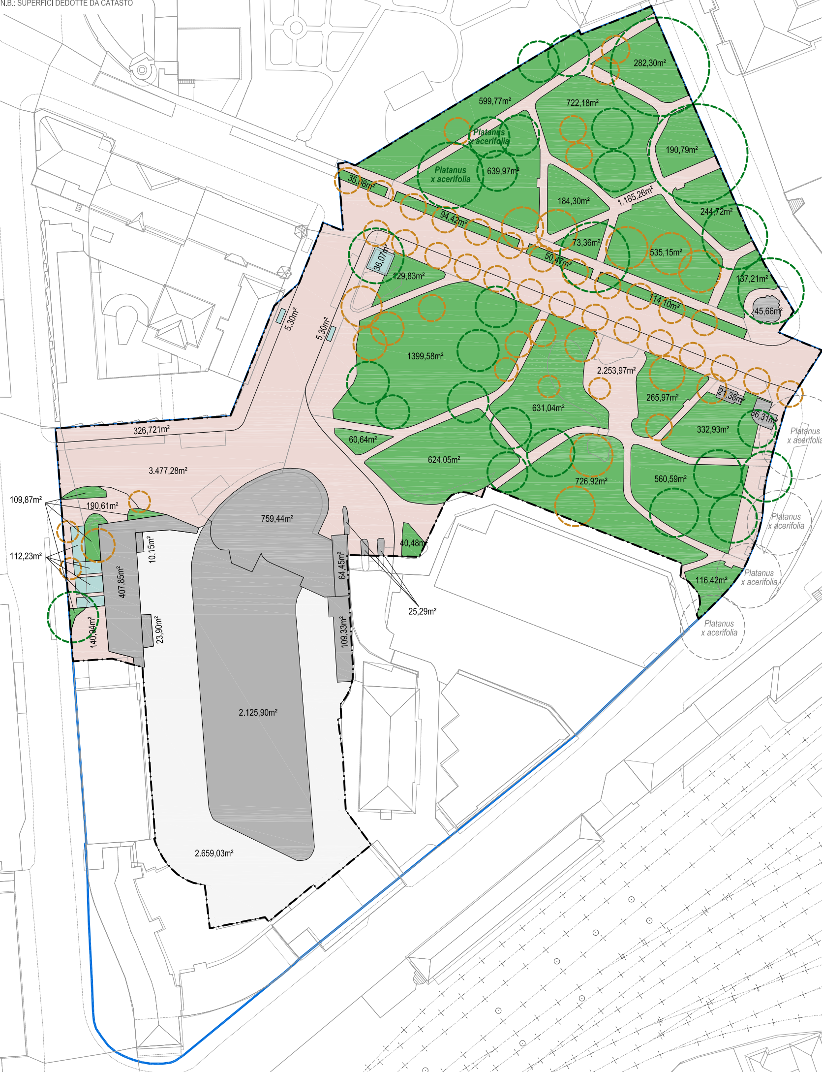
PLANIMETRIA STATO DI FATTO LAGEPLAN BESTAND 1:1000