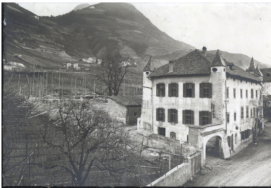
Das Lammwirtshaus als Schulgebäude, 1927

Als der Lammwirt 1885 zum Schulgebäude wurde, waren mehrere Räumlichkeiten zu Klassenzimmern umzubauen; auch wurde in jeder Aula ein beheizbarer Ofen eingebaut, um eine angemessene Winternutzung des Gebäudes zu gewährleisten.