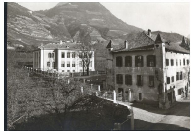
Das neue Rentscher Schulgebäude unmittelbar hinter dem Lammwirtshaus, 1928

Mehrere örtliche Vereine haben seither das Haus bezogen und ihm neues Leben eingehaucht.